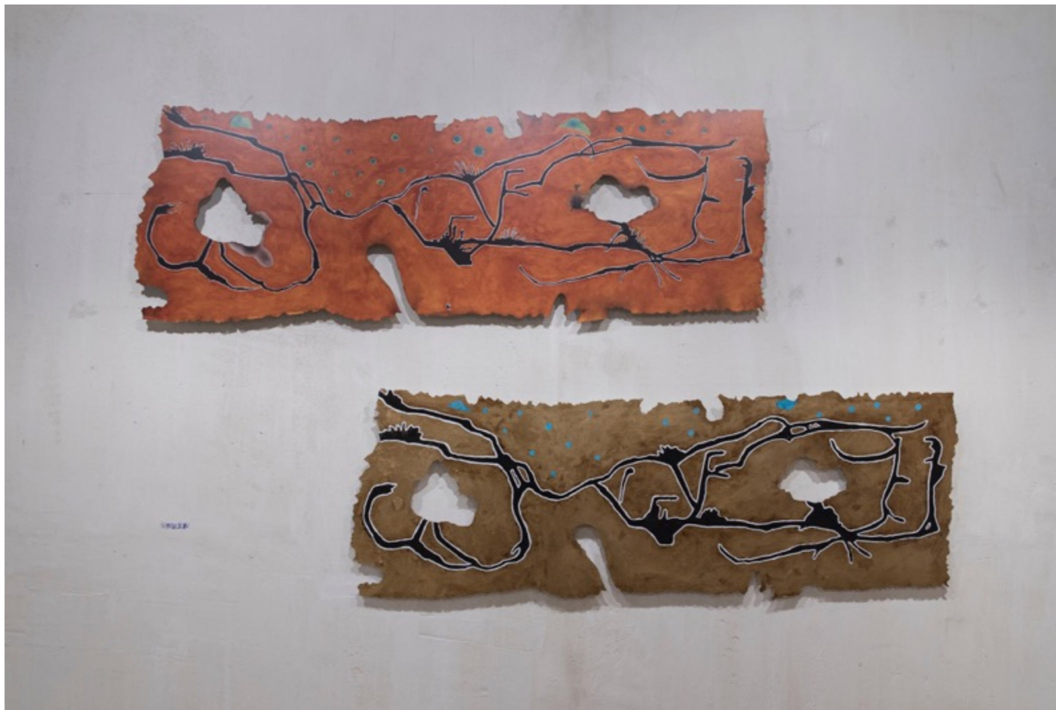
Arriba: Nazca Naranja (Serie Nazca)