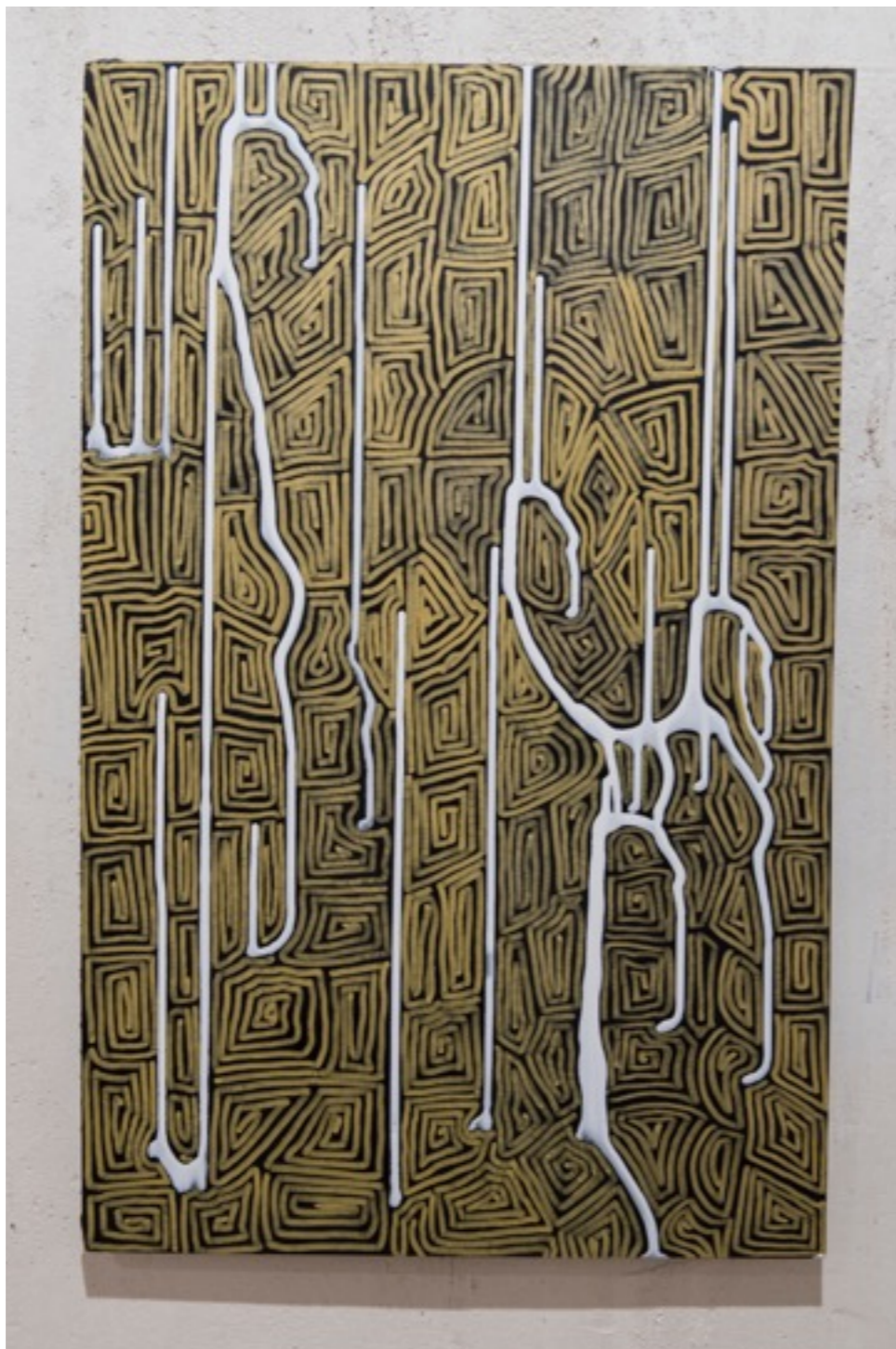
Rectángulos de Nazca I