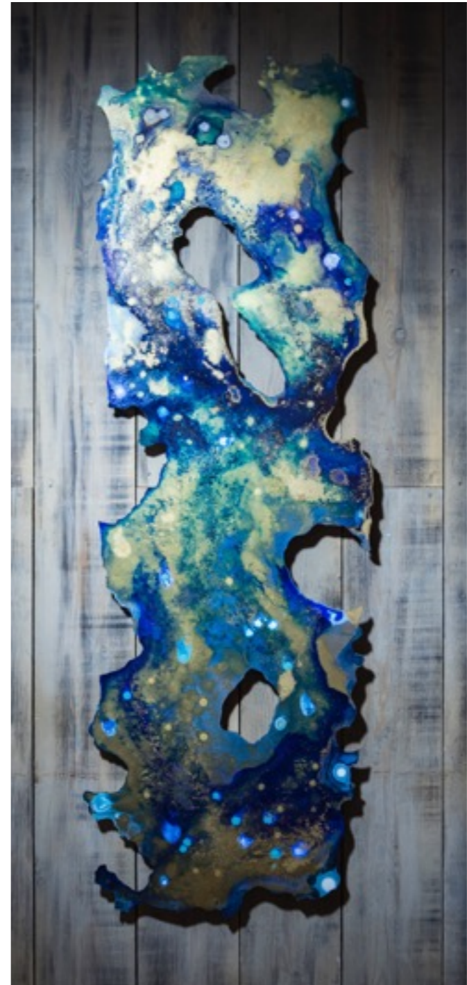
Pedazo de cielo Técnica mixta sobre dibond. 145 x 145 cm.