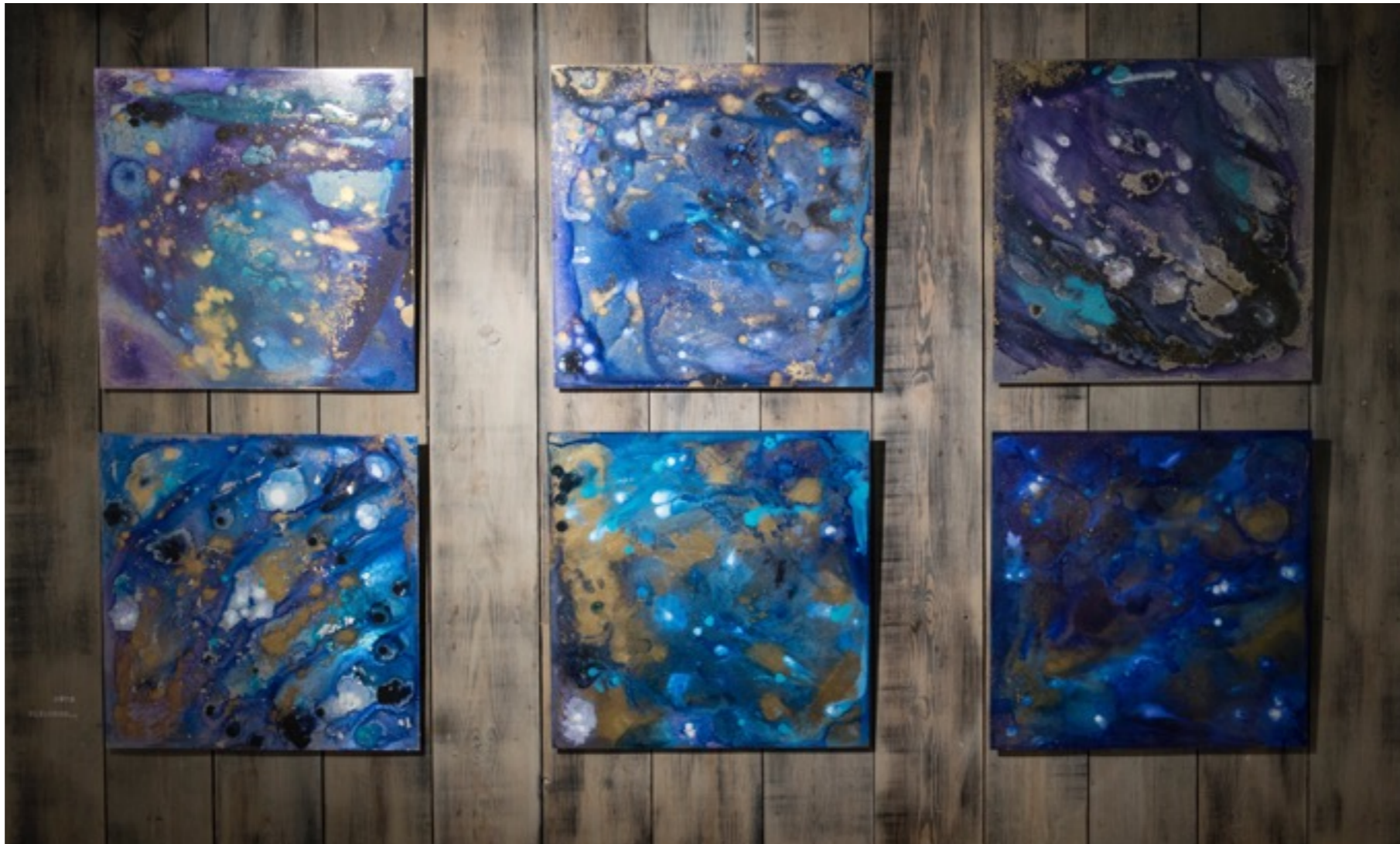
Seis visiones de un navegante nocturno (Serie en busca de El Dorado)