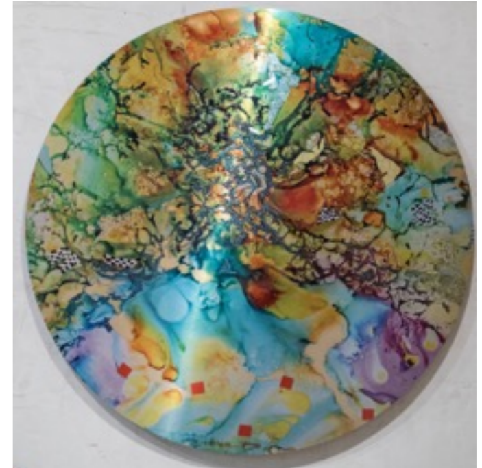
Círculos (Serie Peruano accidental) Impresión Vitra 100 x 100 cm.