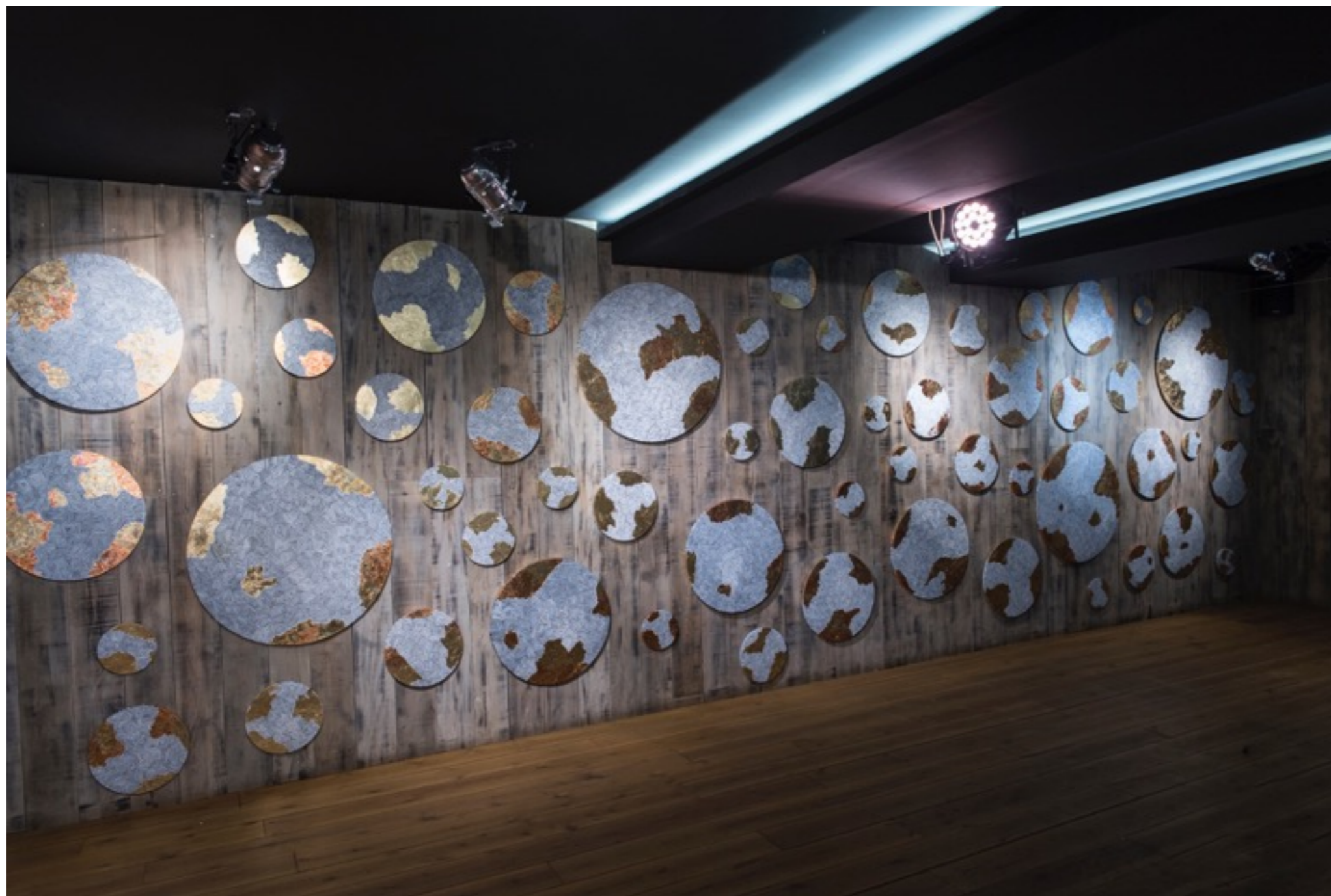
En busca de El Dorado Técnica mixta sobre tela. Medidas variables.