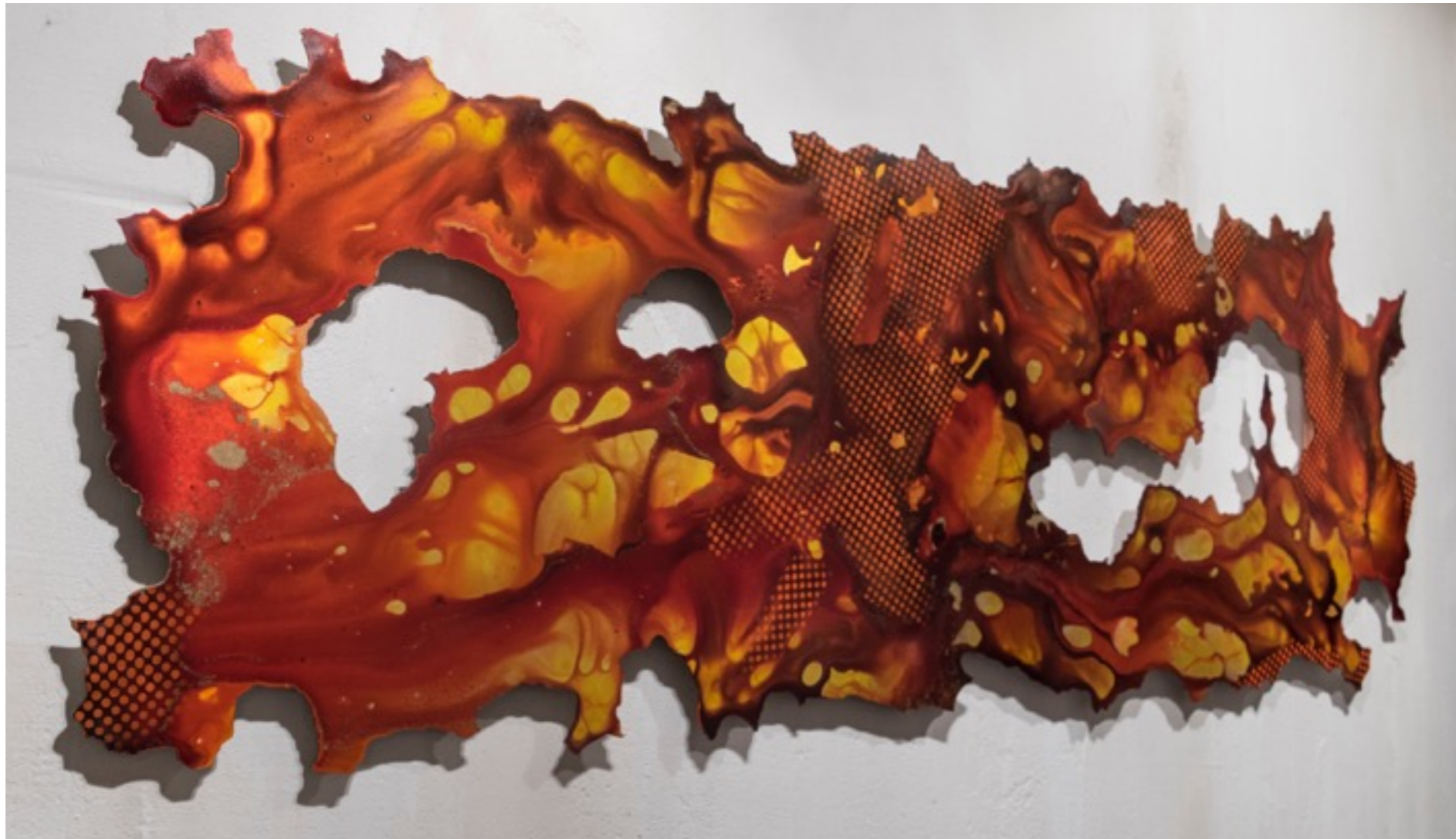
Manto de Fuego Técnica mixta sobre dibond 195 x 65 cm.