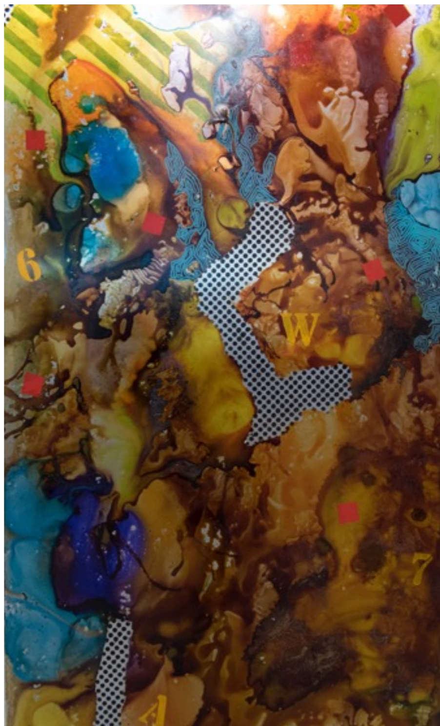
S/T (Serie Peruano accidental)