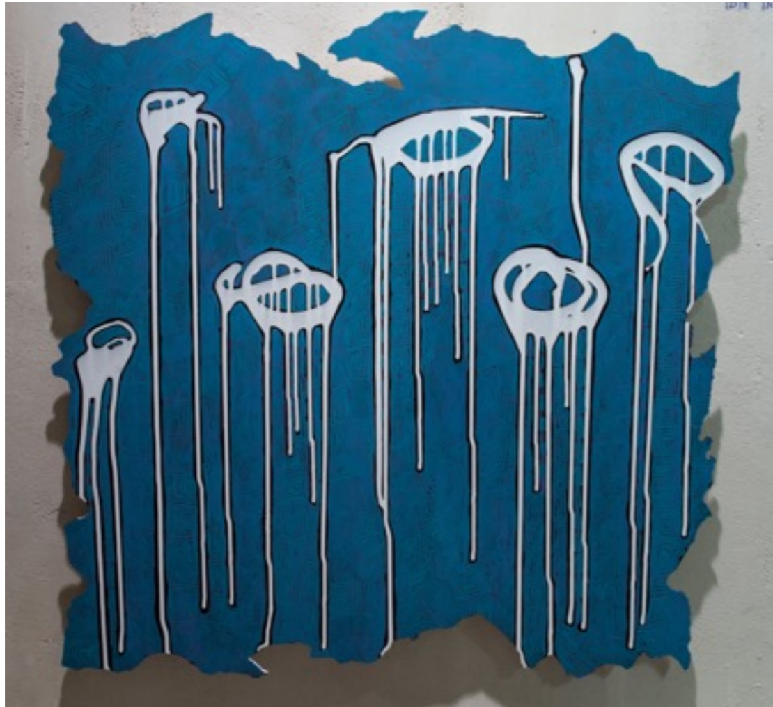
Cuadrados de Nazca