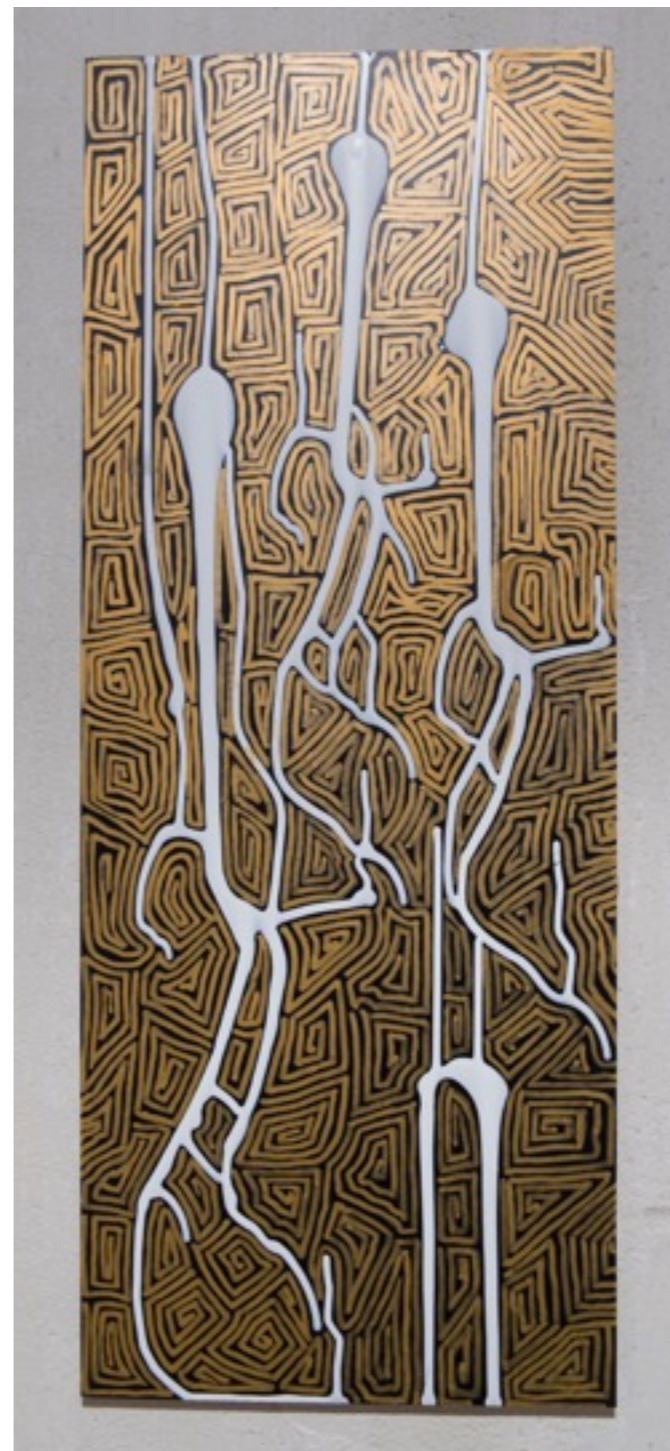
Rectángulo de Nazca II