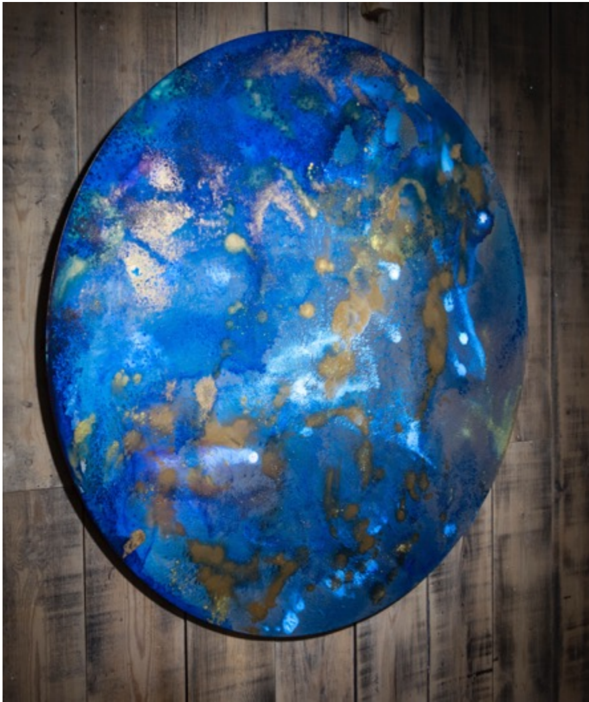
Visión de un navegante nocturno Técnica mixta sobre dibond. 100 x 100 cm.